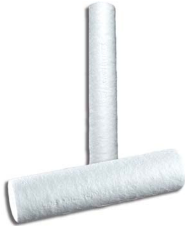
Figure 1 : Purtrex Depth Cartridge Filters